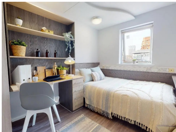
Lambert & Fairfield House

À partir de 415 € par semaine (selon les dates de votre séjour)