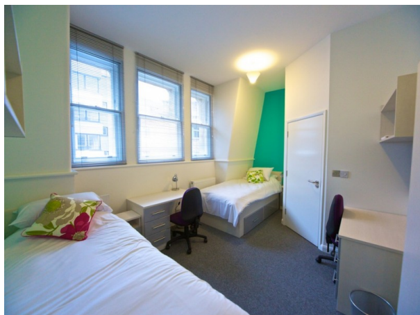
Town Center Residence

À partir de 365 € par semaine (selon les dates de votre séjour)