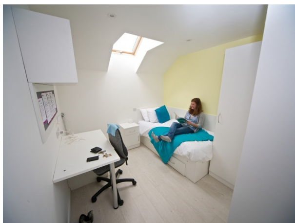
Kings Charminster Residence