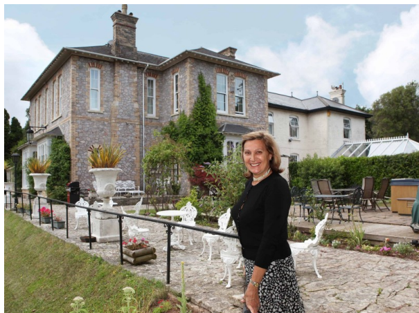
Hébergement chez l'habitant

À partir de 278 € par semaine (selon les dates de votre séjour)