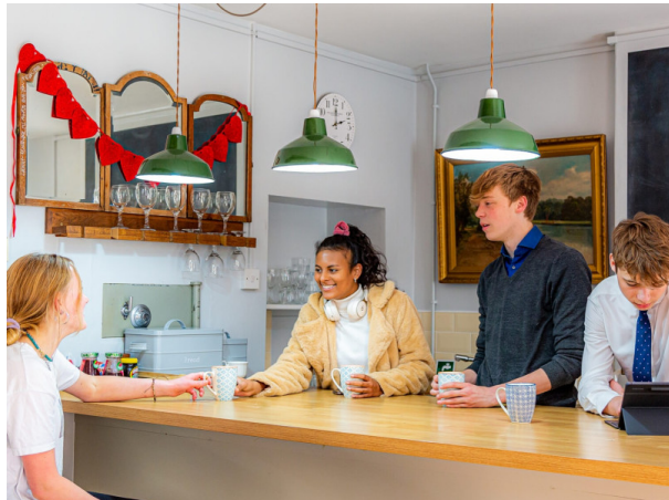
Hébergement en résidence