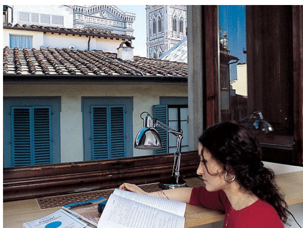
Chambre chez l'habitant

À partir de 395 € par semaine (selon les dates de votre séjour)