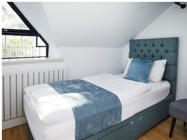
Résidence de l'école

À partir de 282 € par semaine (selon les dates de votre séjour)